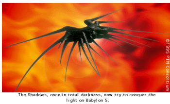
(a) Una Nave