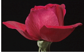
(b) Una Rosa